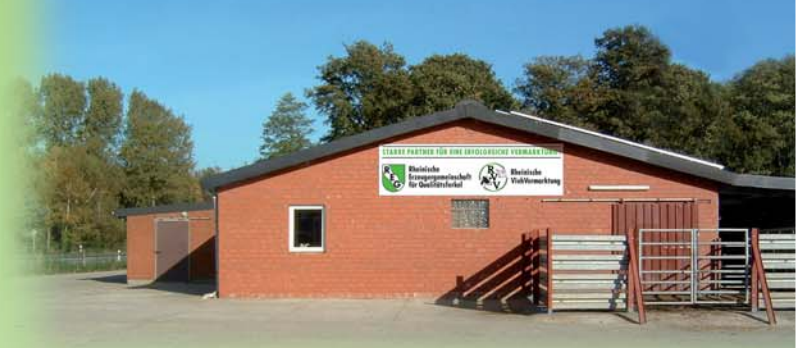
EU-zugelassene Sammelstelle der REG & RVV